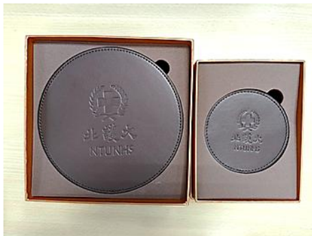
北護大皮質鍋墊、杯墊