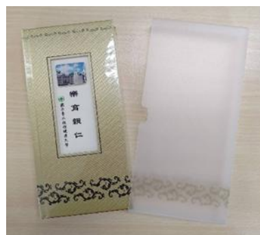
北護大校訓紀念手札