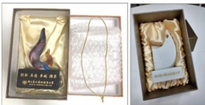
止於至善-鳳凰袖珍小品(水晶、樹脂)