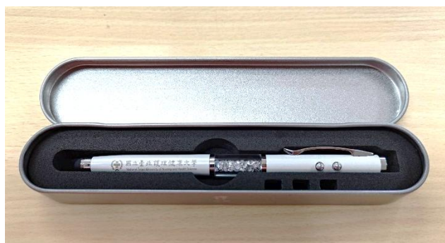
四合一晶鑽觸控筆