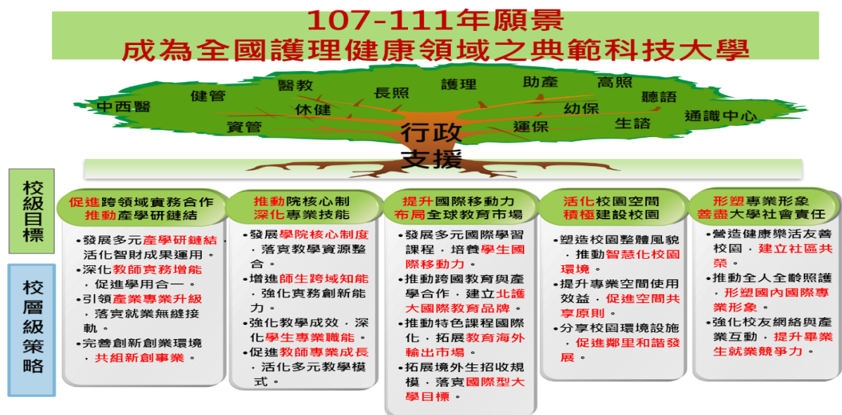
圖(1) 國立臺北護理健康大學 107-111 年近中程發展架構圖

本校以「培育優質健康照護與管理專業人才」為教育目標，長年深耕護理及健康照護專業，透過四個方向辦學理念—「多元創新·體制再造·教學卓越·北護躍昇」，確立本校「107-111 年近中程計畫」之「促進跨域實務合作，推動產學研鏈結」、「推動院核心制，深化專業技能」、「提升國際移動力，布局全球教育市場」、「活化校園空間，積極建設校園」、「形塑專業形象，善盡大學社會責任」等五大目標。透過 14 項校層級策略與行動方案(如圖(1)所示)，期能在健康照護領域中發展成深具特色與影響力的大學。